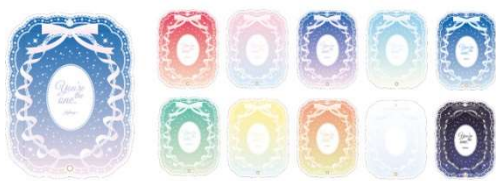
フォトカードアクリルフレーム グラデーションレース (全10種) 収納部分内寸サイズ: 約 W6.5×H9.1×D0.3cm ブラインドパッケージ