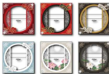
缶バッチアクリルフレーム 東洋風丸窓 (全6種) 収納部分内寸サイズ: W5.8×H5.8×D0.6cm