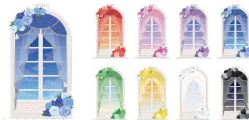
クラシックウィンドウアクリルフレーム (全8種) 収納部分内寸サイズ: 約 W8.0×H15.1×D0.3cm

人気のアクリルフレーム・バッグ・ポーチ・らびぐるみなどかわいいアイテムが台北にも勢ぞろい!